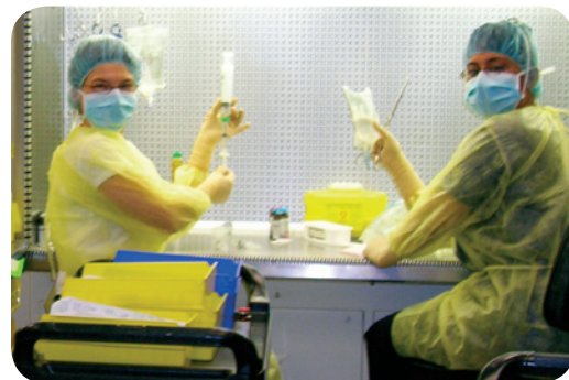
Les techniciens de Coram préparent les médicaments pour la perfusion.

« Les services infirmiers et les cliniques de thérapie intraveineuse de Bayshore permettront à Coram d'étendre la portée des services pharmaceutiques et des soins de santé », explique Sahar Whelan, pharmacienne, directrice de la pharmacie de Coram.