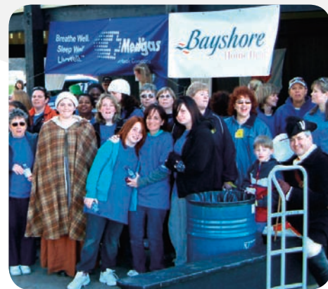
Les membres du personnel de la succursale de Bayshore à Barrie (Ontario), en compagnie de leur famille, à la Marche pour les soins palliatifs de cette année.

Pour en savoir plus, veuillez communiquer avec mmamak@bayshore.ca .