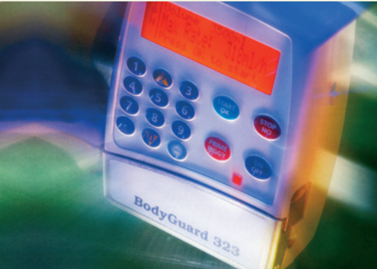
Pompe à perfusion Bodyguard 323 de Caesarea Medical Electronics Ltd.

L'utilisation d'une pompe à perfusion qui simplifie l'administration de médicaments par voie intraveineuse et donne une plus grande liberté aux personnes traitées est un élément essentiel de l'engagement de Rx spécialisés Bayshore à améliorer la qualité de vie de ses clients.